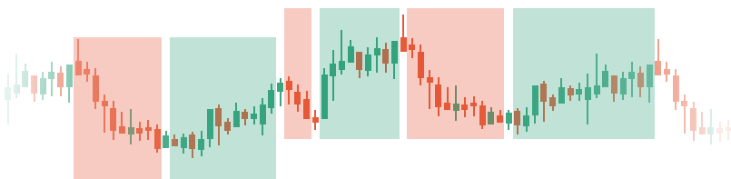
Okresy niskiej i wysokiej zmienności

Zasada 2. Nie handluj w czasie publikacji ważnych wiadomości ekonomicznych. Ten czas nie jest odpowiedni do skalpowania. W okresie publikacji wskaźników makroekonomicznych lub planowanych przemówień przedstawicieli i szefów banków centralnych zmienność jest skrajna.